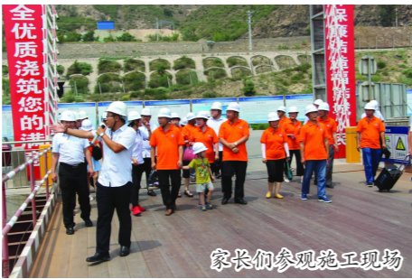
家长们参观施工现场