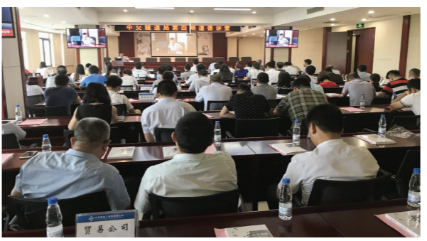
近日,公司在京举办第四期道德讲堂活动,本期主题为国学智慧与人生修养。