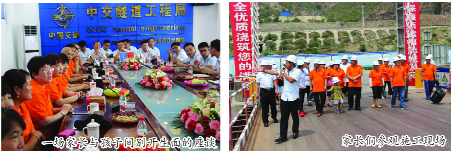
一场家长与孩子间别开生面的鹿戏