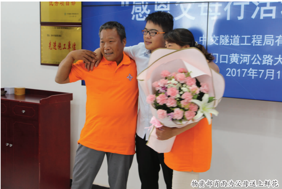
物资部简而为父母送上鲜花