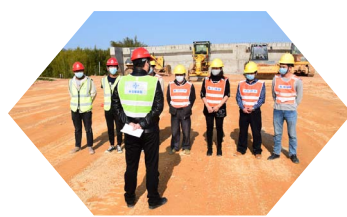
八公司荔玉9分部安排机器、人员进场，对路基路面损坏和便道进行修复。