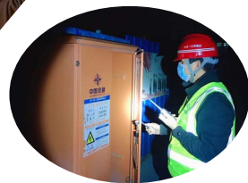
七公司中牟安置房建设项目留守职工夜间值班巡视。