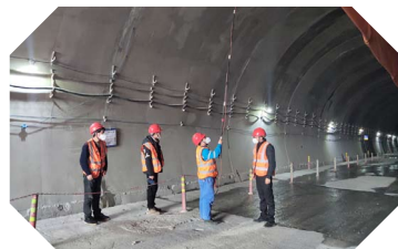
四公司重遵8标项目深入桐梓隧道开展全面细致排查。