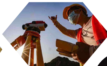
厦门公司海南洋浦疏港大道二期工程项目紧张有序地进行雨污水管沟施工。