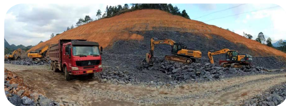
西北公司荔玉高速2分部，进行石山破除。