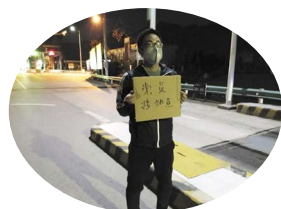
二公司剑榕五标项目党员主动做接站工作，安排工人隔离观察，分发防疫物资。