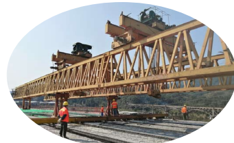
华北公司荔玉3分部项目对龙门吊和架桥机进行检修，准备过孔，测试运行。