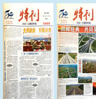
公司成立50周年庆典特刊