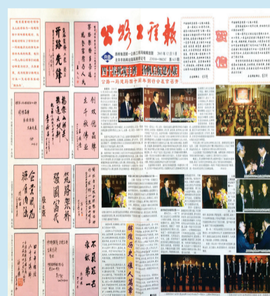
公司成立40周年庆典特刊