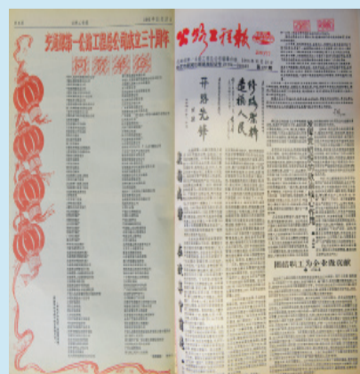
公司成立30周年庆典特刊