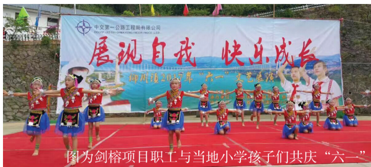
图为剑榕项目职工与当地小学孩子们共庆“六一”

2018年4月，贵州省榕江县忠诚镇乐乡村村干部表示：“剑榕高速项目自2017年进场以来，通过吸收村里剩余劳动力，定点帮扶，带动了村经济发展，你们帮我们修路、做绿化带、组织活动，对我们村的帮助很大，非常感谢！”