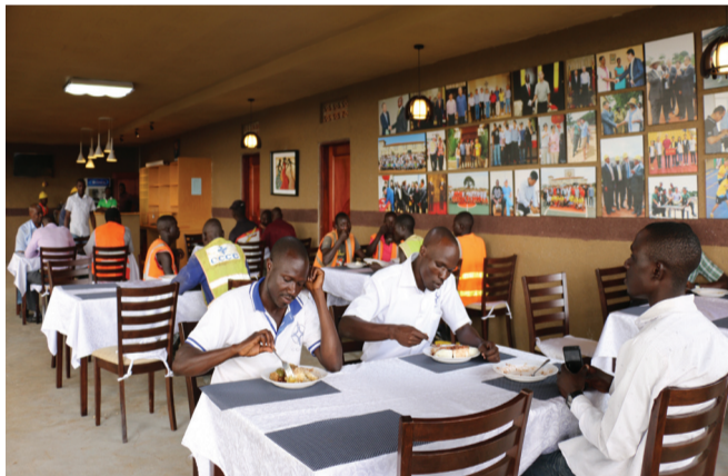
图为乌干达KE项目当地雇员休闲餐厅

项目结合乌干达的法律法规、文化宗教等因素，制定了《项目当地雇员管理办法》、《项目当地雇员薪酬管理办法》等多个管理办法指导推进属地化用工。在具体层面上，项目通过岗前教育、开办技能培训班、技能比武等方式，提高外籍员工的专业素养和技能水平；通