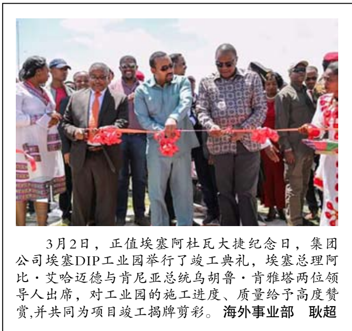
3月2日，正值埃塞阿杜瓦大捷纪念日，集团公司埃塞DIP工业园举行了竣工典礼，埃塞总理阿比·艾哈迈德与肯尼亚总统乌胡鲁·肯雅塔两位领导人出席，对工业园的施工进度、质量给予高度赞赏，并共同为项目竣工揭牌剪彩。海外事业部 耿超