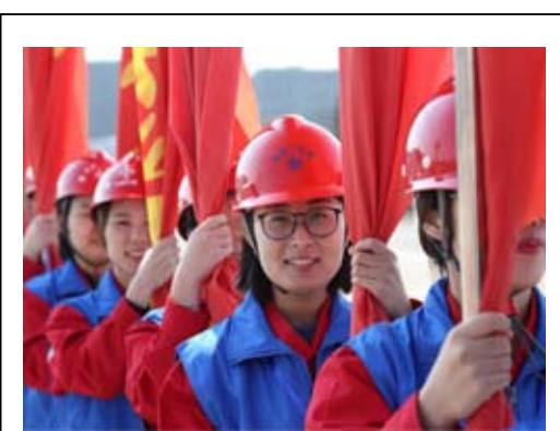
近日，海威公司盐城快速路网三期总承包项目举行的劳动竞赛启动会暨党员先锋队、青年突击队仪式上，全体女职工绽放巾帼风采。

车，拉着我的手，他说：“你来了，就好了，以后我们就不会吵架了。”当时天真的我还说：“时间挤挤总是有的，我才不相信你真的有那么忙呢！”